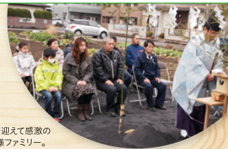
この日を迎えて感激のお施主様ファミリー。