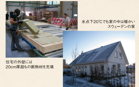
住宅の外壁には20cm厚超もの断熱材を充填