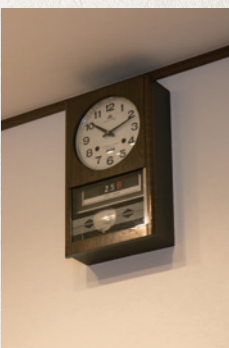
約50年の時を刻んできた振り子時計がリビングにピッタリとマッチ

きにお店にお客さんが来ても、窓を開ければすぐ応対ができます。お客さんの顔も見えて、とても気に入っているんですよ」と、お母様が教えてくれました。