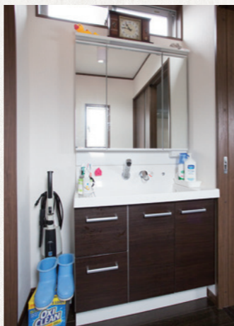
大きな鏡とたっぷりの引き出しで、洗面台も使いやすく