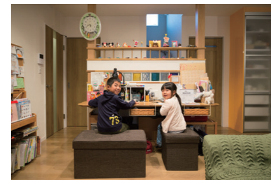
リビングのカウンターデスクで並んで勉強。壁の飾り窓にはお気に入りの小物たちが