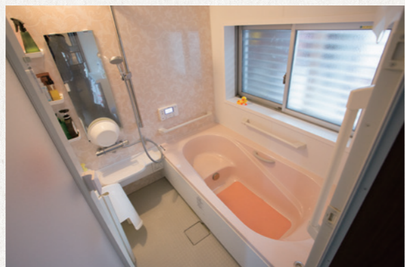
脚を伸ばして入れる広々としたお風呂。浴槽の中と外に手すりをつけました