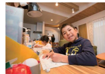
リビング学習で勉強もはかどります