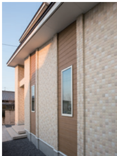
モザイク調の外壁に、ウッディな質感がポイントになっています