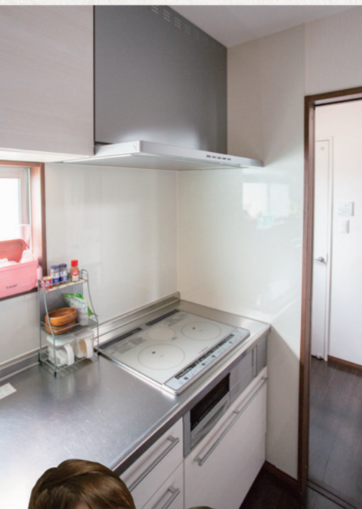
IHキッチンになって換気扇の油污れが全く気にならなくなったそう