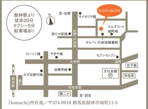
【komachi】所在地/〒374-0018 群馬県館林市城町11-5