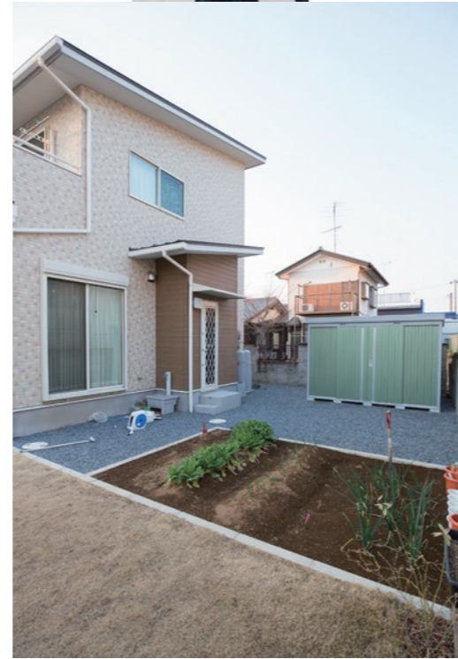
庭の一角にはご主人の趣味である畑が。育った野菜は家族みんなで収穫します