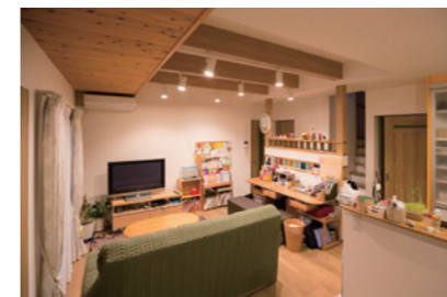
広々と開放感あるリビング空間