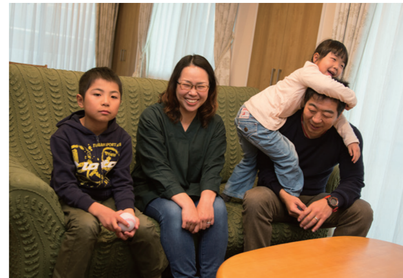
過ごしやすいリビングで、家族の笑顔が広がります