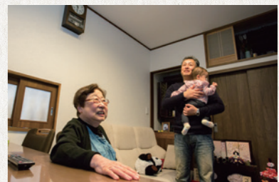
神棚や仏壇もモダンなリビングと調和しています