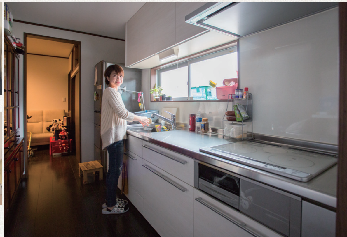
ゆったりとしたキッチンスペース。リフォーム前から使っている食器棚がそのまま置けるような設計になっています