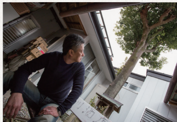
思い出の檜の木を眺めて