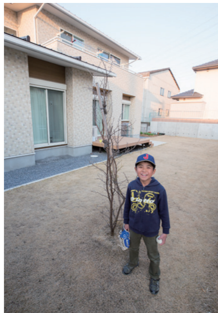
「お庭でキャッチボール、楽しいよ!」