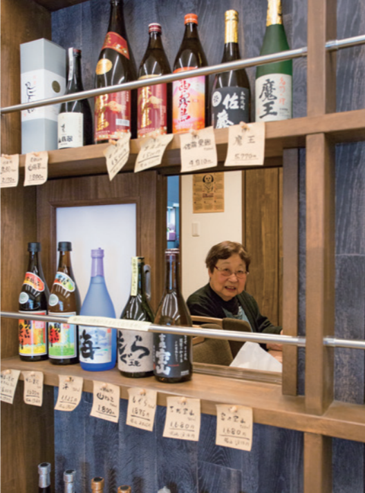
店舗につながる小窓を開ければ、家の中からお客様の顔が見えます