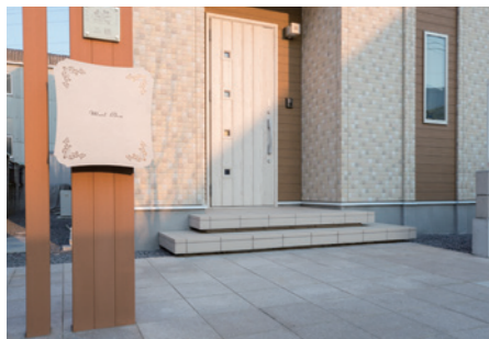
玄関アプローチは軽やかでオシャレな浮き階段。ドアの小窓がアクセント