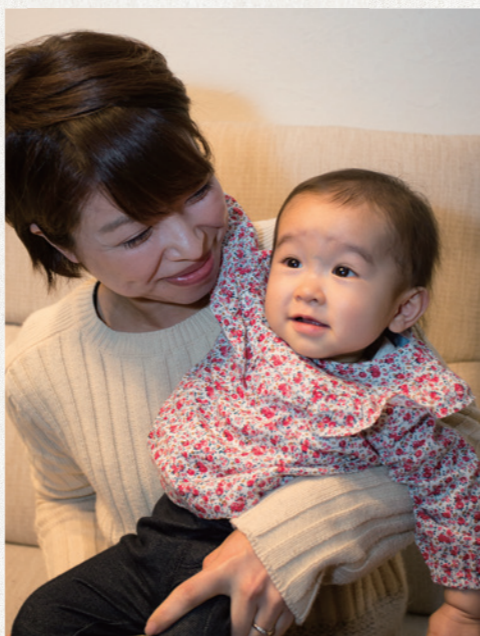
「リフォームで子育てもしやすくなりました!」