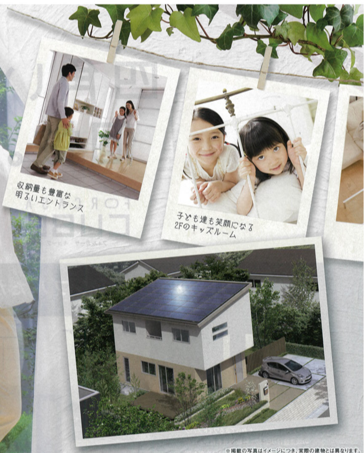
※掲載の写真はイメージにつき、実際の建物とは異なります。