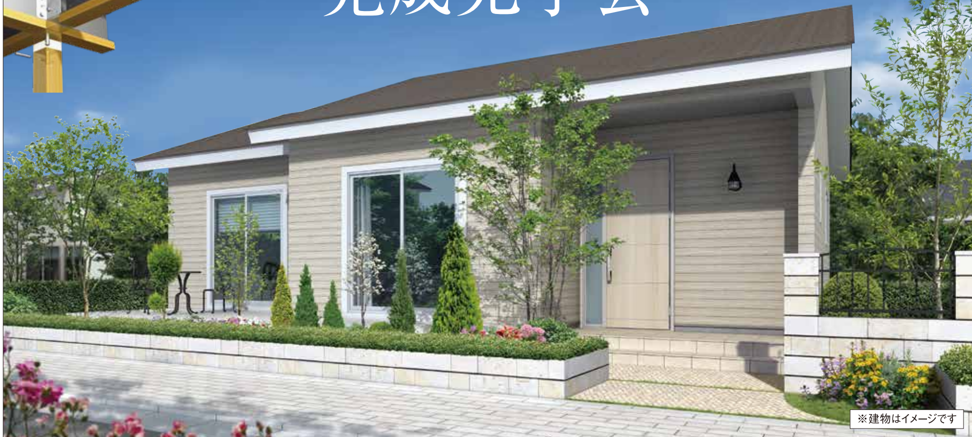
※建物はイメージです